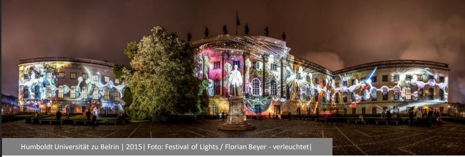
Humboldt Universität zu Belrin | 2015 | Foto: Festival of Lights / Florian Beyer - verleuchtet |

Auch in diesem Jahr werden die eindrucksvollsten Festivalfotos prämiert. Den Teilnehmern am CEWE Fotowettbewerb winken lukrative Gewinne. Gefragt sind Motive der beleuchteten Gebäude und Impressionen rund um das Festival. Die Gewinner werden auf der Webseite des FESTIVAL OF LIGHTS veröffentlicht.